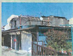
東淀川区西淡路には高射砲の砲台が残っている