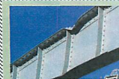
西区の昭和町には、焼夷弾が当たって凹んだ跡が残っている