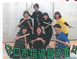
守口市指導員の面々